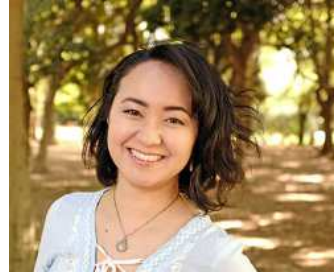
▲大城クラウティア