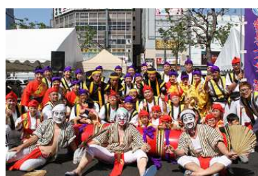
▲鶴見エイサー-潮風