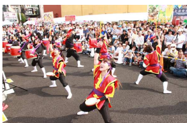
▲エイサー団体による演舞

本土の盆踊りにあたり、各地域に根付く伝統的な踊り「エイサー」。今年はいよいよ、JR川崎駅東口駅前広場に会場を移し、今まで以上にダイナミックな演舞をお楽しみ頂けます。日替わりで10組が登場します。