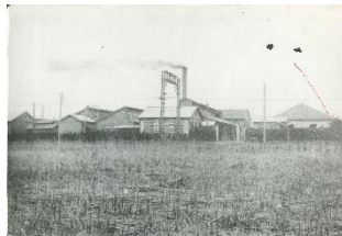
「川崎映画街」予定地 ※現ラ チッタデッラ（昭和11年）