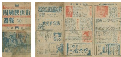
「川崎映画街週報」（昭和23年・現物）