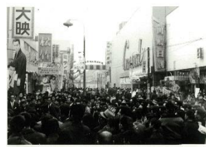
昭和30年代の 「川崎映画街」の賑わい