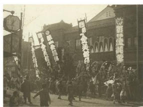
映画館第一号「第一金美館」 （大正11年）