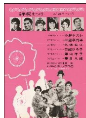
キャバレー 「グランドオスカー」 のチラシ（昭和48年）