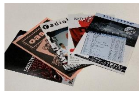
過去クラブチッタの ステージに立った ビッグアーティストたち の公演フライヤー （昭和63年～）

【公式サイト】 https://lacittadella.co.jp/100th/