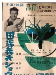
映画館を会場にした “実演”のポスター （昭和30年代）