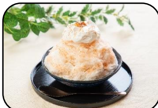
香がらしのホットなチャイかき氷