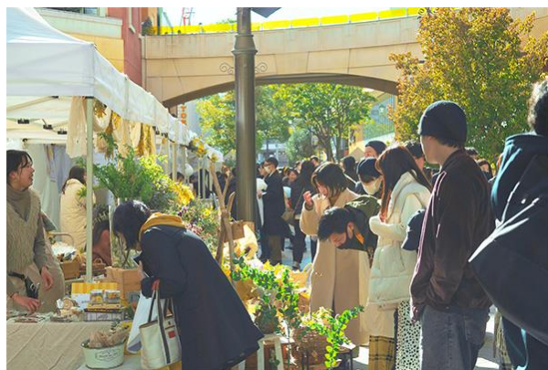
▲マルシェ イメージ