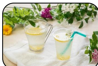
ハニーレモンカモミールティ