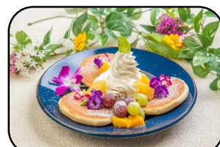
季節のフルーツパンケーキ