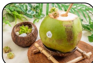
ゼロウェイスト・植物パワーを丸ごと