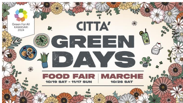
▲CITTA' GREEN DAYS メインビジュアル

さらに、11月からは施設が「FRAGRANCE FORESTS（香りの森）」をテーマにしたイルミネーションで、幻想的な雰囲気になります。この機会に、ラ チッタデッラで植物の潤いと癒しを感じるひとときをお楽しみください。