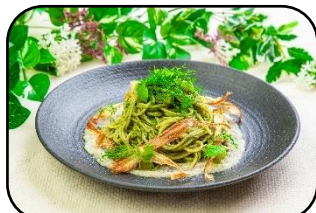
緑化かわさきジェノベーゼスパゲッティ ～牛蒡の香り～