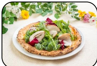
自家製ホルケッタのピッツァ ヴェルデ

さつまいもの甘みと牛蒡のバリバリ食感。爽やかな香りがマリージュしたジェノベーゼ。