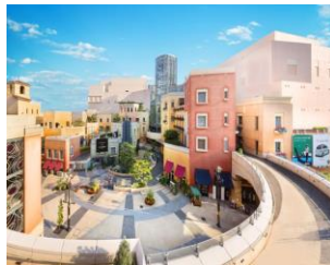
「ラチッタデッラ」外観(現在)

日暮里の地で開業後は震災などを乗り越えたのち、川崎駅前拠点に移し街づくりにも関わってきました。