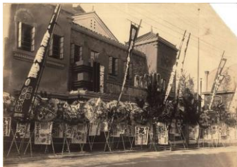
事業のスタートとなった日暮里の「第一金美館」 (大正11年)