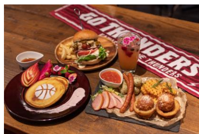
会場限定のコラボメニューが多数登場！！