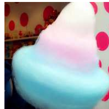
レインボー綿あめ ¥600