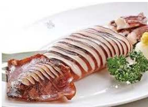
醤油香る！肉厚イカの姿焼き ¥600

【会場】チネチッタ通り、クラブチッタ通り、Arena CITTA'（フットサルコート内）