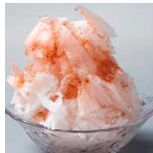
日光の天然かき氷 とちおとめ ¥900