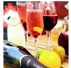
フルーツワインと 夏のドリンク ¥600