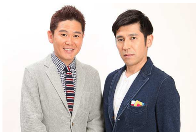
▲ガレッジセール他、様々な芸人・アーティストが登場！