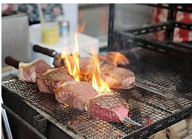
▲石垣牛のシュラスコ（¥1,000）

会場規模が拡大し昨年より約30店増えた約80店舗が出店。沖縄ブランド食材「石垣牛」「あぐー豚」を使った豪快な肉メニュー、世界No.1に輝いた究極のジェラートをはじめとした沖縄スイーツ、県内全ての酒蔵の泡盛が飲めるブースや沖縄ビールなど、沖縄グルメが勢揃いします。