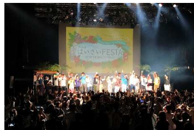
▲観客と一緒に、飲んで歌って大騒ぎの人気企画！