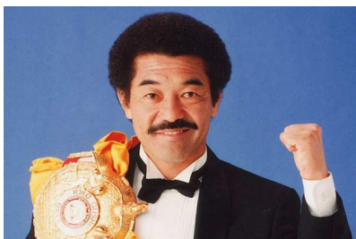
▲今年はいよいよ、あの具志堅用高が初登場！

毎年大人気の後夜祭企画を、今年は土曜日に開催。沖縄のミュージシャンや芸人が多数訪れる人気店『クラブゴリッタ』には、今年もたくさんのお客様が来店します。飲んで歌って大騒ぎする、歌あり、トークありの2時間ステージです。