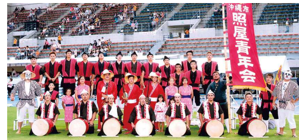
▲沖縄から参加の「照屋青年会」