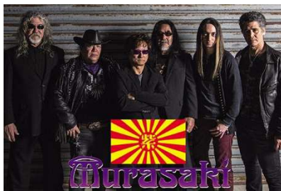
▲伝説のオキナワロックバンド「紫」が登場！