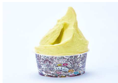
▲沖縄バイン&沖縄セロリ&リンゴのソルベ（¥500） イタリアンジェラートフェスティバル2017世界総合1位・特別賞受賞