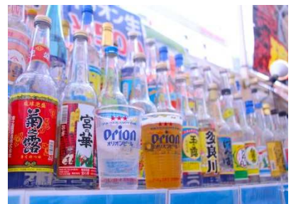
▲オリオンビール（¥600）／泡盛各種（¥500～）