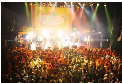
▲毎年夢の共演が見られる『音楽祭』は必見！

今年は15回目を記念し、初の2日間での開催が決定。「オキナワロック」と「沖縄民謡」をテーマに、豪華アーティストが登場します。沖縄音楽の歴史と、神髄に触れることができるスペシャルなライブをどうぞお見逃しなく。