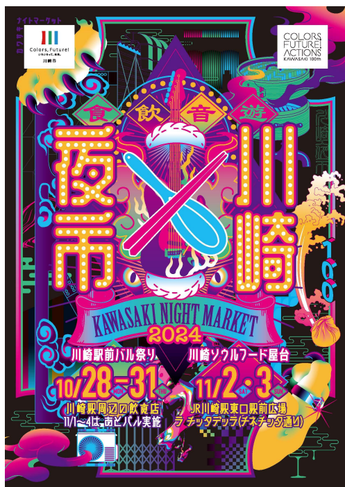
「川崎夜市」ビジュアル

川崎市と、市内のエンターテイメント企業、株式会社 チッタ エンタテイメント（川崎市川崎区）などの川崎夜市実行委員会により、川崎駅東口周辺に多くの行列で人気を博した、KAWASAKI NIGHT MARKET 『川崎夜市』を、今年も開催いたします。