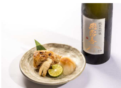
【根ぎし】 FOOD: 炙りのど黒の松茸添え DRINK: 飛露喜 純米大吟醸