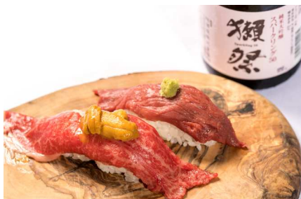
【HANABI】 FOOD: 極上肉寿司2貫 DRINK: 獺祭スパークリング

第10回目の開催を記念して超豪華な限定メニューが登場！美食家ぞろいの小川町バル参加者の舌を唸らす、スペシャルメニューを是非、お楽しみください。 ※各日先着10食まで