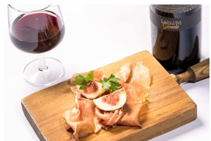
【フリッターリア・ナポレターナ イル・パッチョコーネ】 FOOD: 直輸入バルマ産18ヶ月熟成生ハムと 上越いちじくの盛り合わせ DRINK: イタリアワインの王様 直輸入「パロ-ロ」