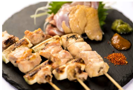
【焼き鳥bar けむり】 FOOD: 天草大王 青森シャモロックの串の盛り合わせと宮崎鶏の刺身 DRINK: スパークリングワイン（シャンドン） or 獺祭 3割9分