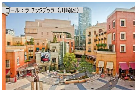
イタリアの街を模した、川崎駅徒歩5分の複合型商業施設