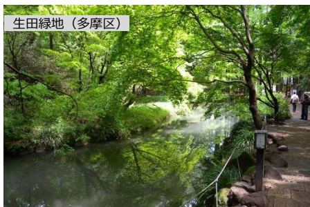
多摩丘陵の一角に位置する川崎市内最大の緑の宝庫