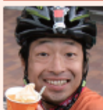
安田大サーカス 隊長安田