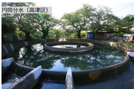
地域の憩いの場となっている農業用水の利水設備