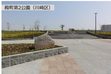
臨海部再開発地域に隣接し、多摩川を望める公園