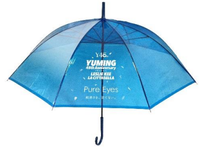
コラボ傘(イメージ)