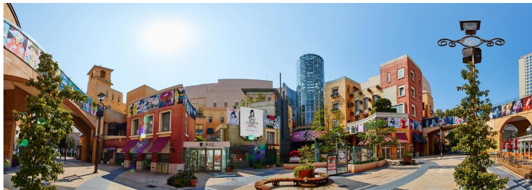
ラ チッタデッラ施設外観 & LESLIE KEE Photo Exhibition