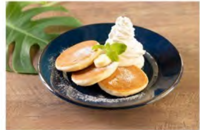
ホイップパンケーキ ¥1,080