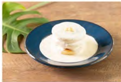
マカダミアナッツパンケーキ ¥1,410