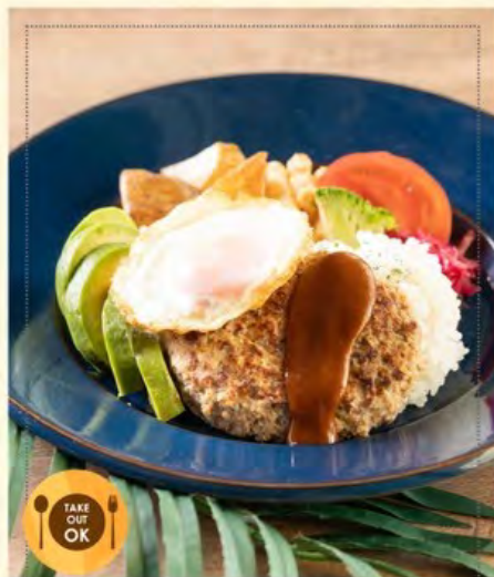
アボカドハンバーグ ロコモコプレート