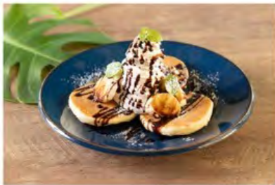
チョコバナナパンケーキ ¥1,410