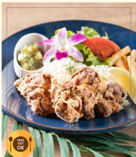
モチコチキンプレート