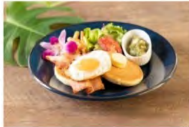
ベーコンエッグパンケーキ ¥1,410