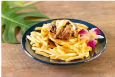
ハニマスチキンパンケーキ ¥1,520