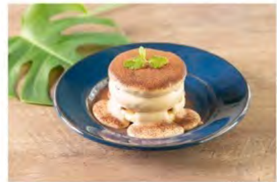
ティラミスパンケーキ ¥1,410