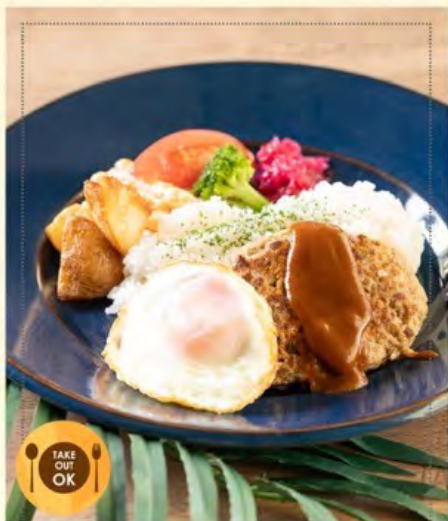
ハンバーグロコモコプレート