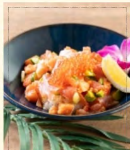
アヒボキライスボウル